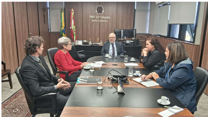
Assunto foi levado à reunião com a Administração do TRT-SC no dia 6 de outubro

A posição do Sindicato, em relação à Calex ou a qualquer ou-