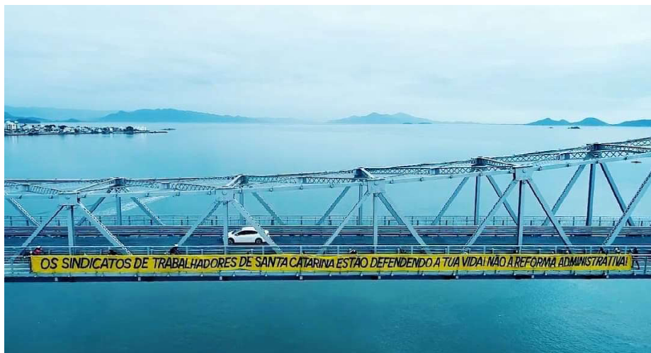
Faixa de 40 metros contra a “Reforma” Administrativa (PEC 32) foi estendida pelo Fórum na Ponte Hercílio Luz

O Fórum é uma articulação de cerca de 30 Sindicatos que foi fundamental para a derrota da “Reforma” Administrativa (PEC 32), tendo, ao longo de 2021 e 2022, feito inúmeros atividades conjuntas, como cam-