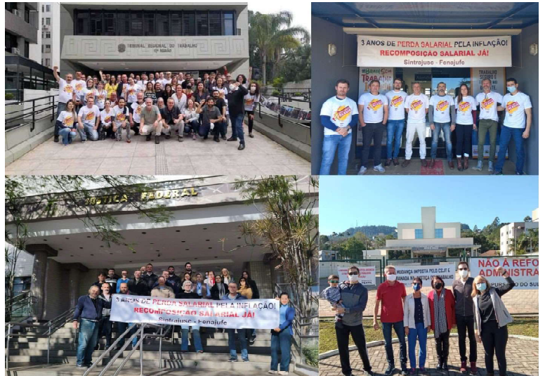
Atividades de mobilização realizadas em 2022 pela recomposição salarial. Primeira parcela saiu em 2023