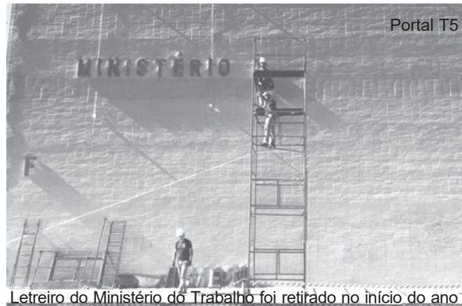
Letreiro do Ministério do Trabalho foi retirado no início do ano

A PEC 300 também pretende dificultar ainda mais o acesso do empregado à Justiça do Trabalho. De acordo com o texto, o prazo prescricional para se ingressar com uma ação, que hoje é de dois anos para os trabalhadores urbanos e rurais após a extinção do contra-