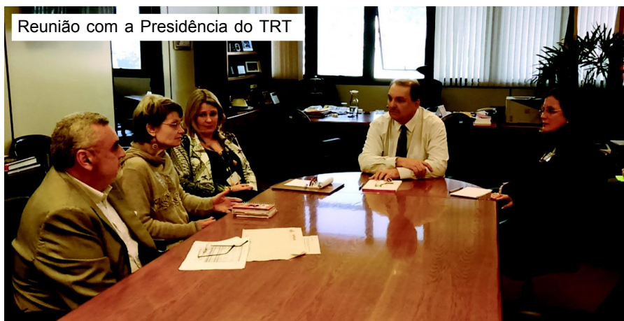
Reunião com a Presidência do TRT

O período pelo qual passa o país e o impacto na vida dos servidores do Judiciário exigem a nossa reflexão. O Congresso é a oportunidade para isso, e juntos vamos avaliar a realidade da categoria e a situação política, econômica e social, definindo a linha de ação do Sintrajusc nos próximos anos. Veja o Edital do Congresso nesta edição.