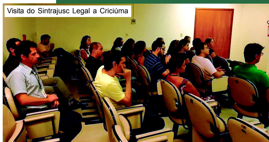
Visita do Sintrajusc Legal a Criciúma