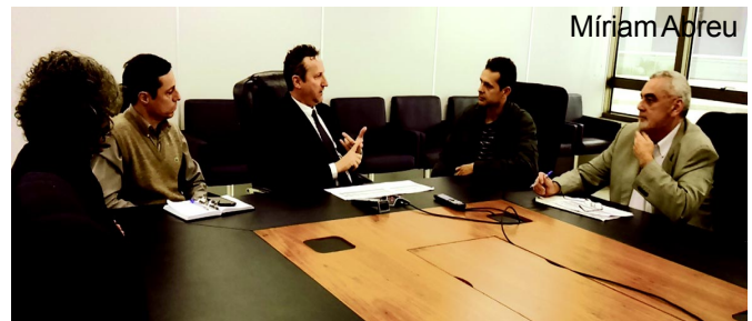
Reuniões ocorreram na Justiça do Trabalho e Federal (acima)

A Administração informou que está buscando realizar concurso público em 2016, mas, caso seja autorizado, sendo o fator tempo já um problema, apenas 10 dos cargos vagos até o momento podem ser providos, que