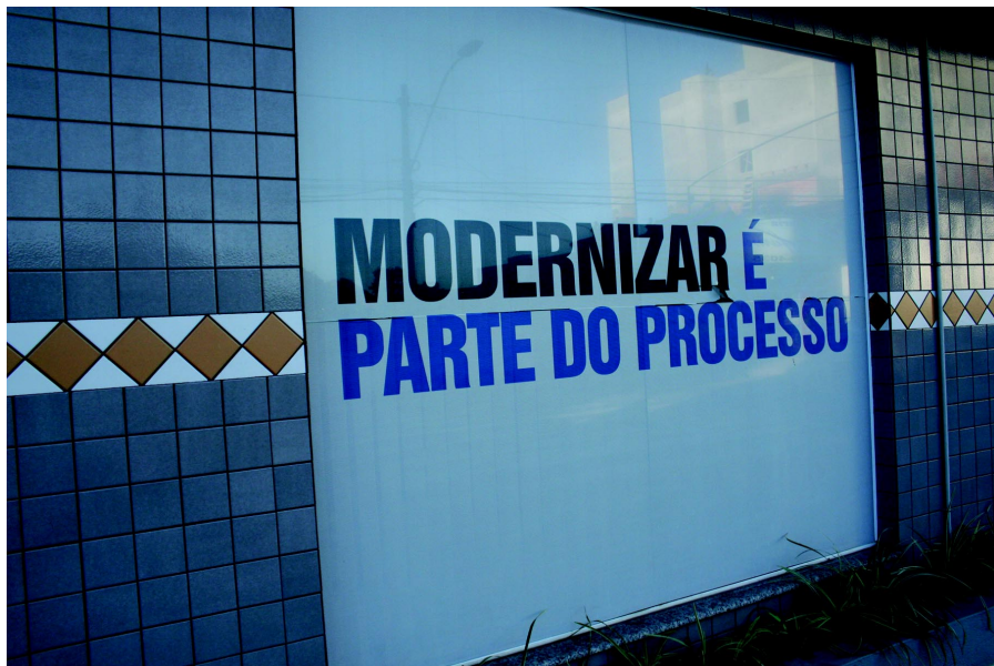
Promessa de modernização anunciada pelos Conselhos ainda não se concretizou

A versão mais recente também trouxe, por exem-