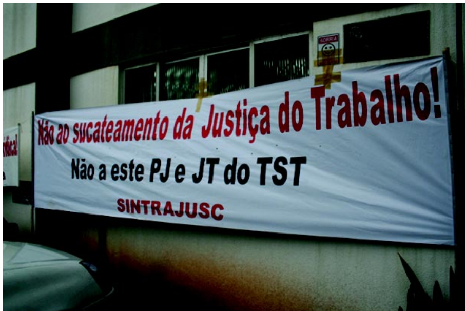
Sintrajusc organizou campanhas por melhorias no processo eletrônico da JT

De acordo com o documento do Conselho, "a ausência de testes automatizados obriga a realização de testes manuais, o que é impraticável em virtude da escassez de recursos humanos alocados nessa área, bem como em função da exiguidade de tempo; e na tentativa de corrigir erros das versões anteriores,