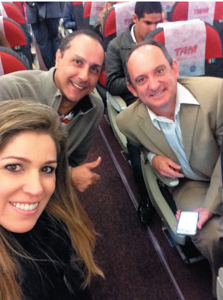
Delegação de SC cedinho no aeroporto rumo a Brasília na luta pela derrubada do veto.

Na expectativa de uma definição sobre o reajuste da categoria, servidores do Poder Judiciário Federal estarão hoje mobilizados no interior da Câ-