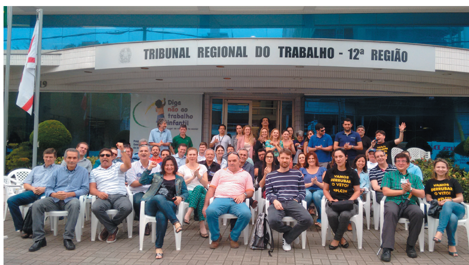
Ato no TRT da Rio Branco, ontem (22), reuniu servidores da JT e JE em defesa do reajuste.