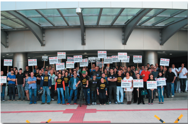
Florianópolis e outros municípios mantêm greve.

Em Assembleia realizada nesta quarta-feira, 12, na Justiça Federal, após o Ato Unificado, os servidores aprovaram a continuidade da Greve até a derrubada do veto do Executivo ao PLC 28/2015. A categoria em SC irá enviar nota à Fenajufe dizendo não à proposta rebaixada negociada pelo STF. Joinville, Chapecó e Blumenau também avisaram ainda ontem que rejeitam a proposta e continuam em Greve.