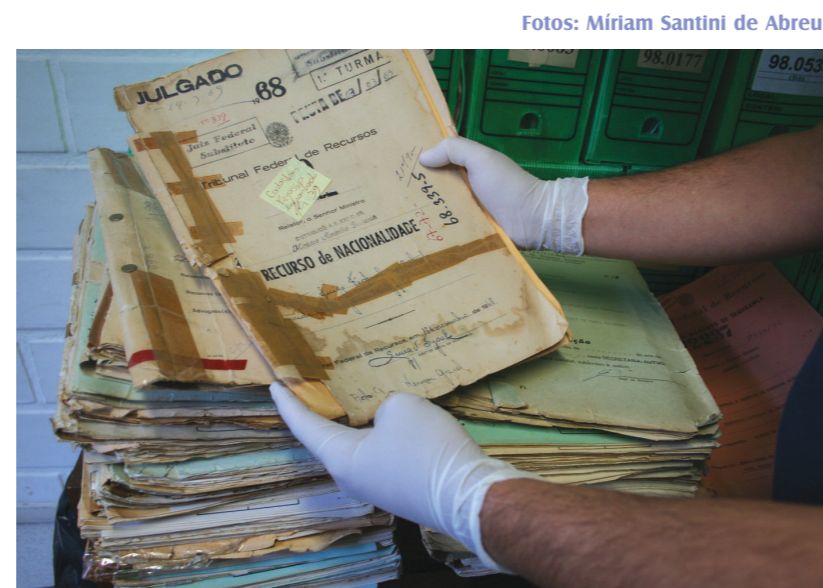
Acima, processos antigos manuseados por servidores no Arquivo da Justiça Federal; abaixo, estação de trabalho no prédio das Turmas Recursais, onde há intenso trabalho de digitação